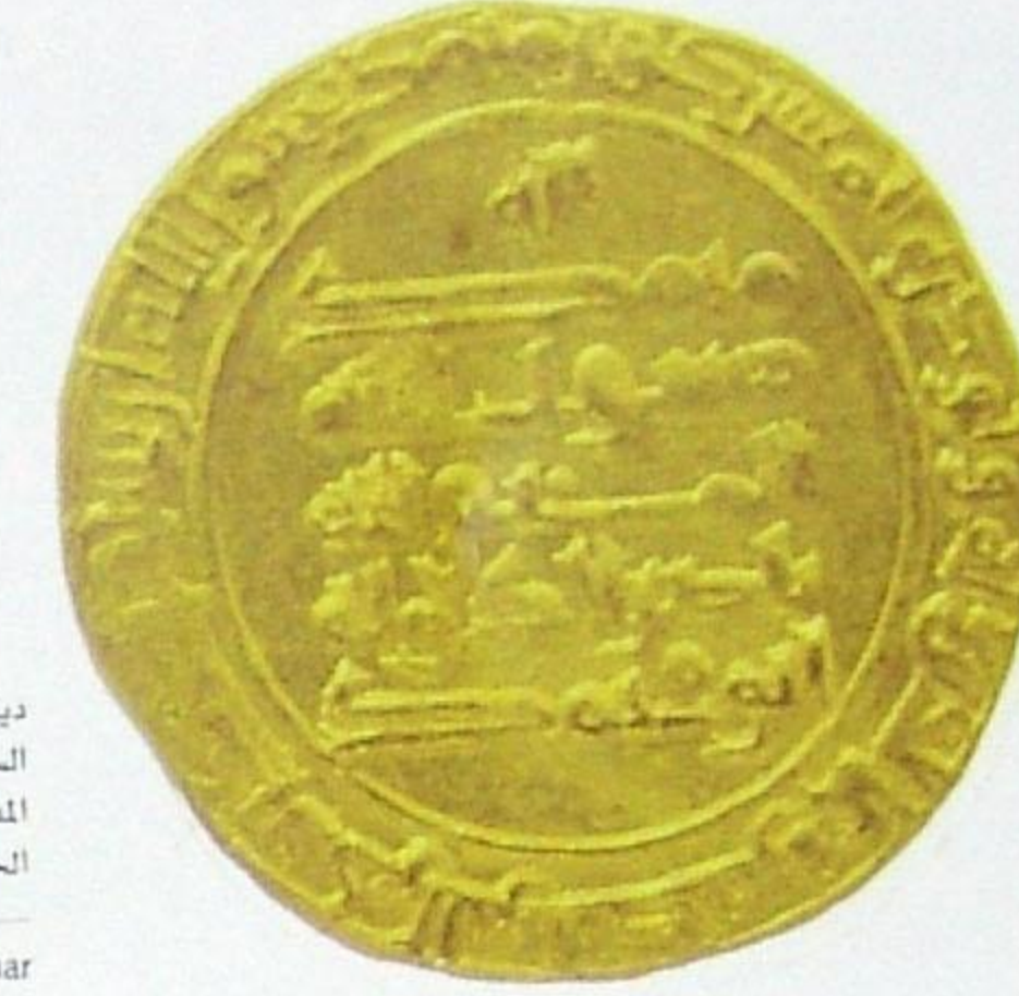
دينار حمداني السنة: ٣٣٠ هجري المدينة: السلام الحاكم: ناصر سيف الدولة Hamdani Dinar Year: 330 H Mint: Madinat Al Salam Ruler: Nasser Seif Al-Dawla

These two dynasties ruled Egypt and issued coins similar to those of the Abbaside Khalifate, but added the name of the Tolooneite or Akhshidi ruler to the name of the Abbaside Khalifah.